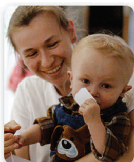
Franiu z mamą