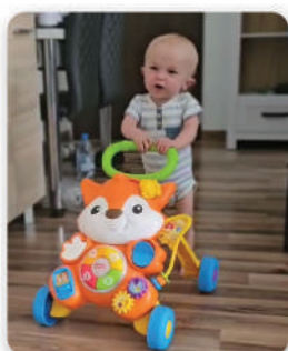
Franiu stawia pierwsze kroki